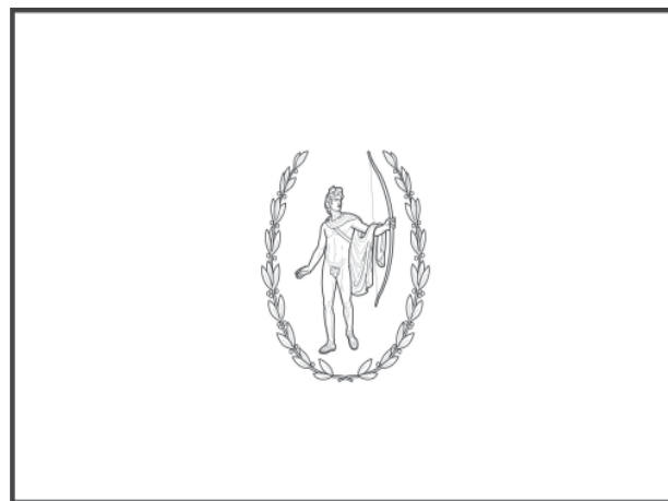
Drapelul Institutului Patrimoniului Cultural

În drapel imaginea zeului patron a fost încadrată de o cunună ovală care sugerează ovalul scutului, constituită din două ramuri din laur, ca planta cea mai frecvent asociată cu Apollo.